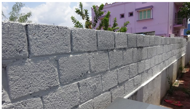
Mur d'enceinte réparé

Le Centre Rajam a été construit sur un terrain initialement consacré à une étable. Ce mur a été conservé pour fermer la cour du Centre. Avec le temps, la pluie de la mousson l'a endommagé. Les travaux de réfection ont été réalisés fin 2023 pour la sécurité de tous