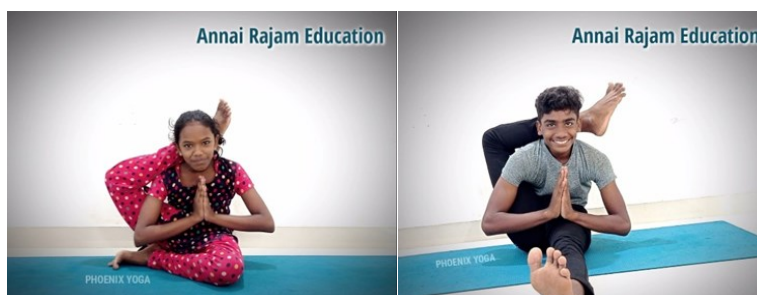
Classe de yoga

Leur professeur remarque une très grande participation des élèves, une assiduité au cours de yoga qui favorise la stabilité psychologique, la diminution du stress aux examens.