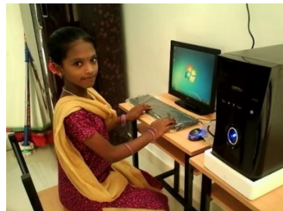
Premier cours d'informatique : mai 2015

❖ acheté 4 ordinateurs et initié les premiers cours d'informatique (mai 2015) ;