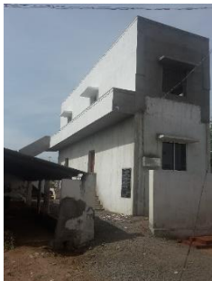
1er étage et ses 2 salles de 18m 2 (salles 2 et 3)

- en hauteur avec la construction d'un premier étage permettant l'ouverture de 2 classes de 18m 2 chacune (salles 2 et 3) ;