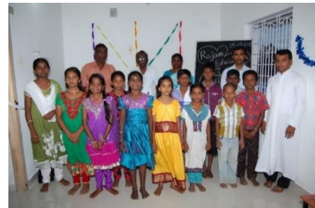
Accueil du groupe 2 : 10 août 2015

24 enfants viennent chaque soir, pour du soutien scolaire, apprendre l'anglais et l'informatique.